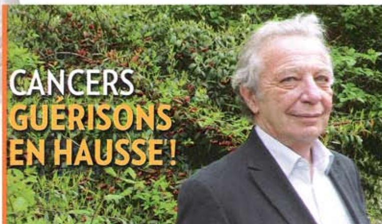
Le Pr Dominique Maraninchi, président de l'Institut national du cancer, révèle les résultats du récent rapport qui montrent une nette amélioration.

PARIS MATCH N°3179 p.110 du 22 au 28 avril 2010